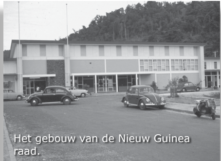
Het gebouw van de Nieuw Guinea raad.