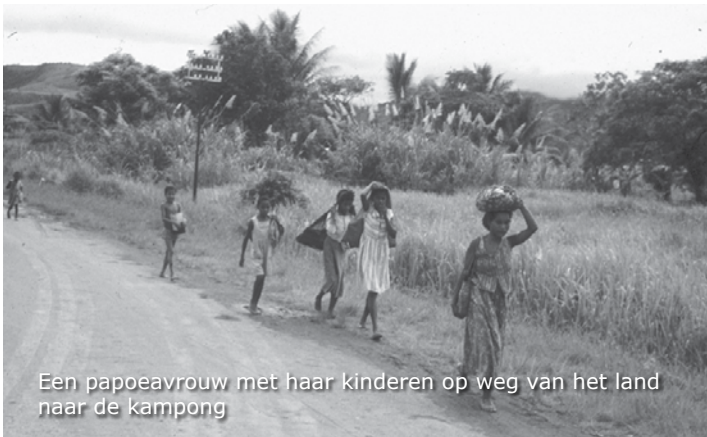
Een papoeavrouw met haar kinderen op weg van het land naar de kampong

De volgende dag gaan we naar Sentani. We worden beneden aan de voet van de berg afgezet en lopen er wat rond. Onderweg komen we hier en daar wat papoea's tegen. Als ons een groepje papoeavrouwen tegemoet komt, gaan deze van de weg af en lopen door de alang om ons te ontlopen. Als we na een tijdje omkijken lopen deze vrouwen al weer op de verharde weg. Een vreemde gewaarwording. Dit hebben we in Sorong nog niet meegemaakt.