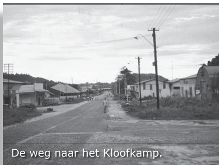
De weg naar het Kloofkamp.