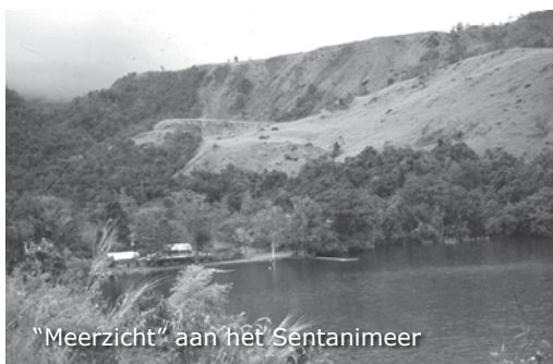
"Meerzicht" aan het Sentanimeer

Een voortreffelijke maaltijd, een heerlijke nachtrust. De hele week zondagsdienst, uitslapenen gekleed in burgerkloffie is het iedere dag weer genieten. Deze dag gaan we weer naar beneden en nadat we zijn afgezet, lopen we naar "Meerzicht", dat aan het Sentanimeer ligt. Veel mensen uit Hollandia gaan hier zondags naar toe. Als we er aankomen zijn we er alleen. De eigenaar vraagt waar we zin in hebben en geeft aan dat hij lekkere biefstuk op het menu heeft staan. Nou na ruim negen maanden weer eens een lekker biefstukje gaat er wel in en we bestellen er allemaal een.