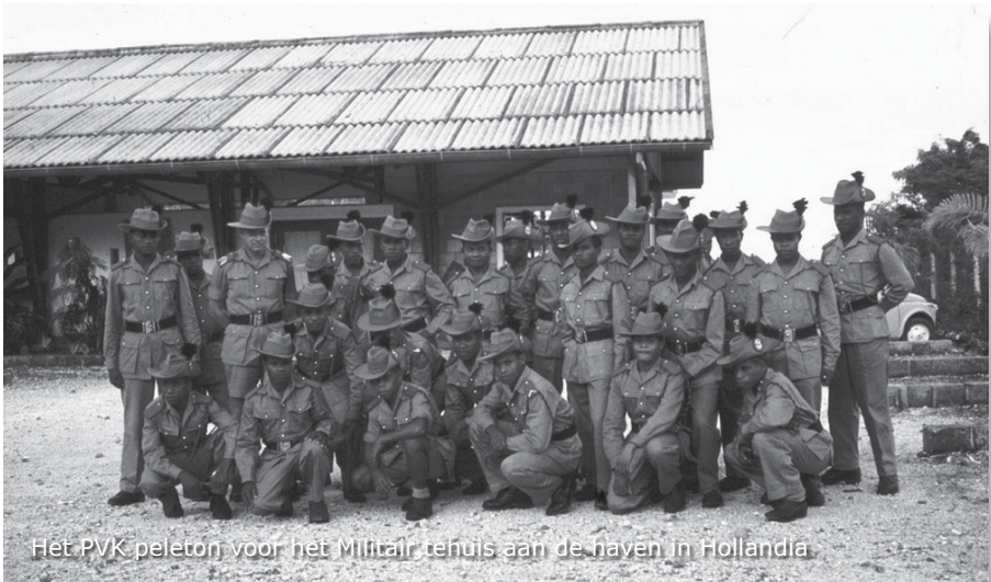
Het PVK peleton voor het Militair tehuis aan de haven in Hollandia

Als we terug zijn in Ifar is het al bijna donker. We krijgen 's avonds te horen dat de PVK'ers morgen, zaterdag, naar Hollandia gaan. Er wordt ons gevraagd of we zin hebben met hen mee te rijden. Wij spreken af dat we meerijden. Zaterdagmorgen horen we ook dat we na 8 dagen Ifar op maandag 24 april naar Biak vliegen.