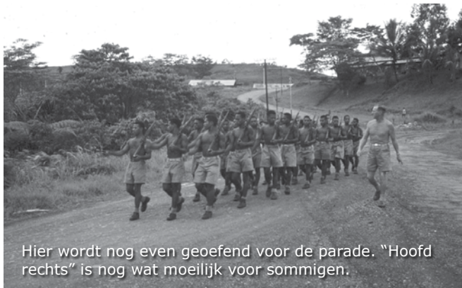
Hier wordt nog even geoefend voor de parade. "Hoofd rechts" is nog wat moeilijk voor sommigen.

De PVK'ers oefenen iedere dag behoorlijk fanatiek voor de komende parade. Hoofd rechts is nog niet voor iedereen even makkelijk te doen. Ook een enkeling heeft net zoveel problemen met het opzwaaien van de armen als ik. Het verschil met mij is dat hij het waarschijnlijk wel zal leren. Mijn armen hebben nooit de gewenste opzwaai hoogte bereikt. Voor mij was dat wel een manier was om herkenbaar in de massa te blijven met een eigen identiteit.