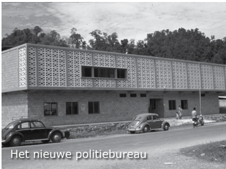
Het nieuwe politiebureau