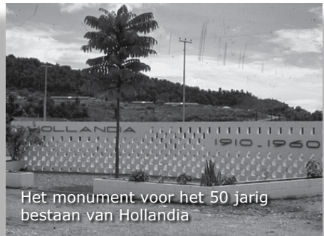
Het monument voor het 50 jarig bestaan van Hollandia