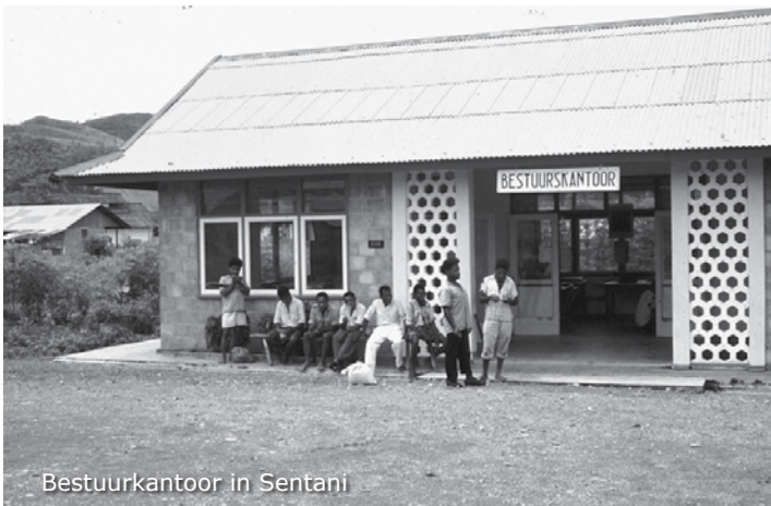
Bestuurkantoor in Sentani

Voor het bestuurskantoor is het gezellig. In de buurt van het kantoortje staat een Vespa scooter. Ik maak van de gelegenheid gebruik om er eventjes op te gaan zitten. Als ik in Sorong terug ben ga ik proberen mijn motorrijbewijs te halen. Is eenvoudiger dan in Nederland. Weinig verkeersborden, geen verkeerslichten, alleen een beetje heuvelachtig.