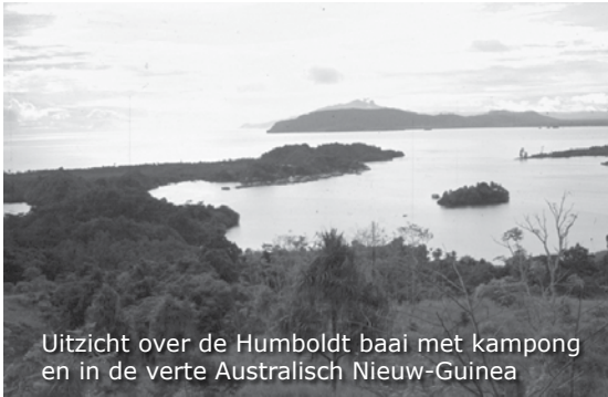
Uitzicht over de Humboldt baai met kampong en in de verte Australisch Nieuw-Guinea

De volgende morgen, woensdag al weer, gaat de eigenaar van de toko naar Hollandia en vraagt of we zin hebben om met hem mee te rijden. Dat hoeft hij ons geen twee keer te zeggen, dus spreken we een tijd met hem af. De volgen de ochtend rijden we met zijn volkswagen busje, het algemene vervoermiddel hier, naar Hollandia. De weg zit vol haarspeldbochten en volgens onze chauffeur zijn het er 158 over een afstand van ongeveer 40 kilometer en een hoogteverschil van circa 600 meter. Aan het linkse verkeer zijn we al gewend, hoewel alle auto's het stuur wel aan de linkerkant hebben. Onderweg stappen we uit om van het uitzicht over de Humboldt baai te genieten. We zien in de baai een kampong met paalwoningen. In de verte ligt, zo wordt ons uitgelegd, Australisch Nieuw-Guinea.