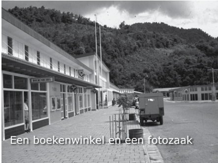
Een boekenwinkel en een fotozaak

Wij lopen eerst wat rond over een markt waar Papoea's hun groente verkopen. De groente ligt uitgestald op doeken die op de grond liggen. Er wordt druk gehandeld. Terwijl we naar het winkelcentrum, dat er nieuw uitziet, lopen zien we dat kapitein Sachse de oprichter is van Hollandia, ruim 52 jaar geleden. Ter ere van het 50 jarig bestaan van Hollandia heeft men in 1960 een monument opgericht. Dit monument ligt centraal in Hollandia met aan de ene kant het winkelcentrum, met aan de andere kant de jachthaven.