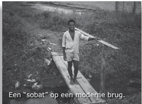
Een "sobat" op een moderne brug.

We zien ook dat er voor de politie een nieuw kantoor is gebouwd. Het is nog niet helemaal klaar, zo nieuw is het. Het is nogal warm en we gaan in een restaurant, "Juliana", onze dorst lessen. Binnen zien we voor het eerst sinds we Nederland achter ons hebben gelaten een Jukebox.