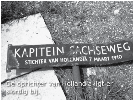
De oprichter van Hollandia ligt er stordig bij.

Hierna zijn we al snel in Hollandia. Het is op het eerste gezicht een ruim opgezet stadje. We worden bij de haven afgezet. Over een paar uur worden we weer opgepikt om terug naar Ifar te gaan.