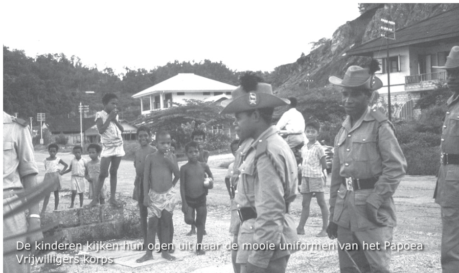
De kinderen kijken hun ogen uit naar de mooie uniformen van het Papoea Vrijwilligers korps

Er komt een echte bus om het PVK en ons op te halen om naar Hollandia te gaan. We zitten prima en de weg er naar toe kennen we al een beetje. We rijden weer langs het Sentanimeer, Meerzicht en natuurlijk langs het geweldige uitzicht over de Humboldt baai. We worden afgezet bij het Militair tehuis aan de haven. Daar vragen we aan de PVK'ers of we een foto van hen mogen maken. Daarvoor wordt door de heren echt geposeerd.