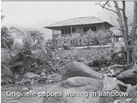
Originele papoea woning in aanbouw

We lopen over de weg weer terug richting Sentani en zien vanaf de weg Ifar liggen. Ook zien we onderweg een mooie papoea woning aan een kali, die nog niet helemaal klaar is.