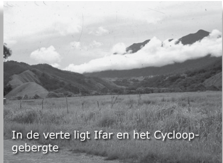
In de verte ligt Ifar en het Cycloopgebergte

Als we terug zijn in Ifar is het al bijna donker. We krijgen 's avonds te horen dat de PVK'ers morgen, zaterdag, naar Hollandia gaan. Er wordt ons gevraagd of we zin hebben met hen mee te rijden. Wij spreken af dat we meerijden. Zaterdagmorgen horen we ook dat we na 8 dagen Ifar op maandag 24 april naar Biak vliegen.