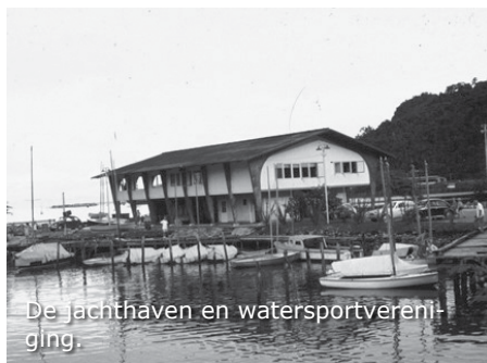
De jachthaven en watersportvereniging.

Nadat we de PVK'ers op de foto hebben gezet gaan we onze eigen weg. Aan de haven ligt het mooie botenhuis van de watersportvereniging. Er liggen wat zeilbootjes en er wordt ook gezwommen. Eigenlijk heerlijk om ook een duik te nemen in het water van de Humboldt baai. Helaas, geen zwembroek bij ons. Het is jammer dat het Kloofkamp iets te ver weg is voor de korte tijd die we hebben. Het is zaterdag en daardoor genoeg te beleven. Een groot verschil met een doordeweekse dag. Ook draaien we nog maar een paar plaatjes bij "Juliana".