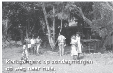
Kerkgangers op zondagmorgen op weg naar huis.