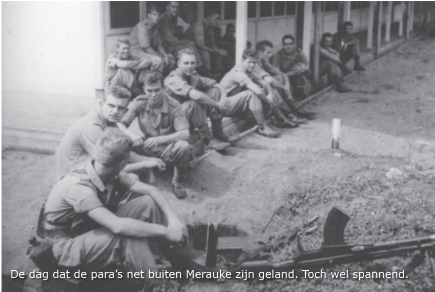
De dag dat de para's net buiten Merauke zijn geland. Toch wel spannend.

Eerst zijn we naar het rijstproject, in de buurt van kampong Koepruk gegaan. Daar hebben we al het rijdend materieel onklaar gemaakt, zodat de Indonesiërs er geen gebruik van konden maken. Toen we weer terug naar Merauke gingen, was ik nog brenschutter. Komt er ineens een Papoea uit de bush gerend. Ik dacht dat het een plopper was. Ik had m'n vinger al aan de trekker. Ik had 'm bijna zo voor zijn raap geschoten. Nog net op tijd zag ik dat het goed volk was.