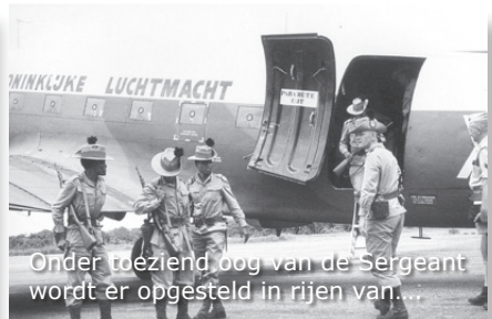
Onder toezien oog van de Sergeant wordt er opgesteld in rijen van...

Als we op het vliegveld aankomen zien we tot onze verrassing dat er een nieuwe groep PVK'ers is geland. We kunnen het platform gewoon oplopen en een paar foto's van de groep maken terwijl ze uitstappen. Op het vliegveld is er veel belangstelling van de plaatselijke bevolking. Je kunt goed zien dat men trots is op de jongens van het PVK.