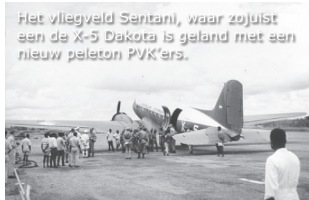
Het vliegveld Sentani, waar zojuist een de X-5 Dakota is geland met een nieuw peloton PVK'ers.

Op zondag lopen we nog wat rond in Ifar en zien wat papoea's de kerk uitkomen. 's Avonds zien we hoe de PVK'ers het varken klaar hebben gemaakt voor een heerlijke maaltijd. Ook de sateh ziet er goed uit. Alles bij elkaar een perfecte avond. Een mooie afsluiting van onze onvergetelijke vakantie in Ifar. De volgende dag maken we ons klaar voor vertrek naar het vliegveld. Het mooie leventje is bijna afgelopen. Het is de bedoeling dat we met een Dakota van de Luchtmacht naar Biak zullen vliegen. Vandaar zullen we woensdag 26 april terug vliegen via Manokwari naar Jefman.