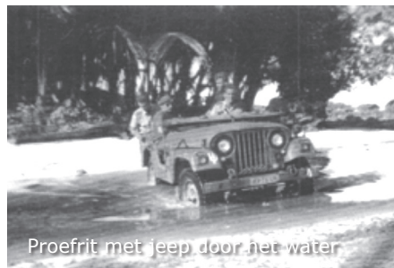
Proefrit met jeep door het water

Als MTOO verantwoordelijk voor dat wagenpark. Ik en mijn mannen hadden een duidelijke opdracht. Zorg dat die voertuigen in optimale staat blijven. Kortom, het hele zaakje moest rijklaar worden gehouden. Gelukkig ook met assistentie van een TD-groep.”