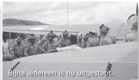
Bijna iedereen is nu uitgestapt.