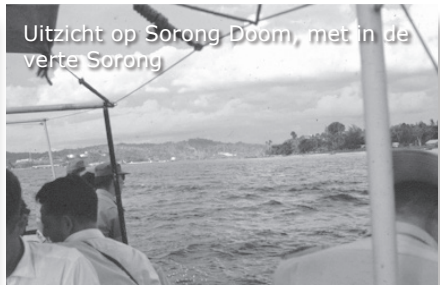
Uitzicht op Sorong-Doom, met in de verte Sorong