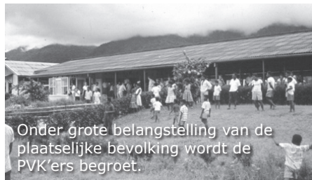
Onder grote belangstelling van de plaatselijke bevolking wordt de PVK'ers begroet.

Als we op het vliegveld aankomen zien we tot onze verrassing dat er een nieuwe groep PVK'ers is geland. We kunnen het platform gewoon oplopen en een paar foto's van de groep maken terwijl ze uitstappen. Op het vliegveld is er veel belangstelling van de plaatselijke bevolking. Je kunt goed zien dat men trots is op de jongens van het PVK.