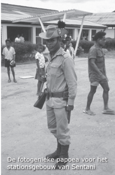
De fotogenieke papoea voor het stationsgebouw van Sentani

Hierna worden we verzocht aan boord te gaan van de Dakota van de Luchtmacht. Als we wachten tot deze vertrekt, zegt een van de bemanningsleden dat we niet bang moeten zijn als de Dakota wat scheef trekt. Hij zegt dat dit vliegtuig hetzelfde euvel heeft als een fiets die niet spoort. "Komt door een van de motoren die eens ergens tegenaan is geknald, waardoor de "kist" steeds scheef trekt". Volgens hem heeft de piloot er goed mee leren vliegen.