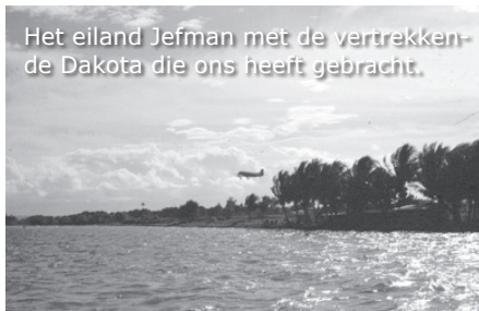
Het eiland Jefman met de vertrekkende Dakota die ons heeft gebracht.

We zijn al op het bootje onderweg van Jefman naar Sorong als wij de Dakota zien opstijgen om weer terug naar Biak te vliegen. Nog een uurtje varen en we zijn weer 'thuis'.