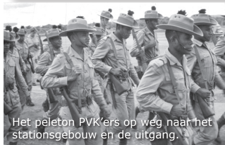
Het peloton PVK'ers op weg naar het stationsgebouw en de uitgang.