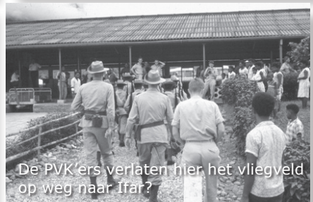
De PVK'ers verlaten hier het vliegveld op weg naar Ifar?