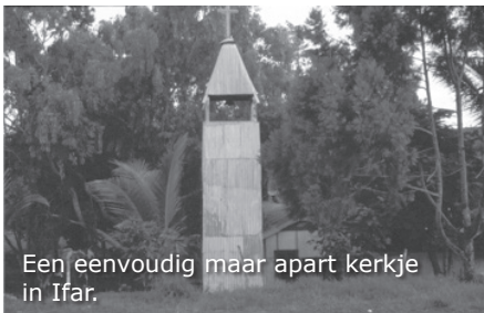
Een eenvoudig maar apart kerkje in Ifar.

Het is zo donker dat we buiten niets zien. Ineens horen we twee keer achter elkaar een harde bonk van iets waar de bus overheen rijdt. Er wordt iets geroepen en iedereen juicht hard. Er stappen er een paar uit. Even later komen die terug met een varken, waar de bus overheen is gereden. De buit wordt goed bekeken en ze zeggen dat er morgenavond sateh van zal worden gemaakt. Ook wij worden uitgenodigd. Geweldig om dit mee maken. Het waren ineens weer de echte Papoea's alsof ze op jacht waren geweest. De ukelele en de atlas waren vergeten.