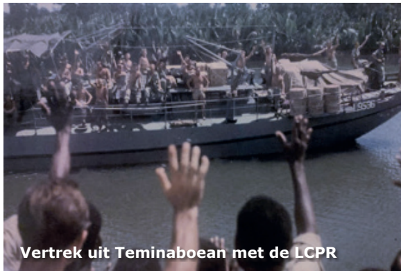
Vertrek uit Teminaboean met de LCPR