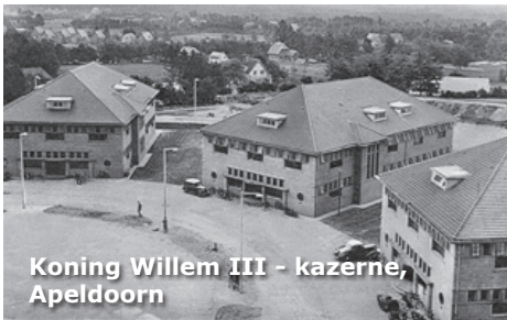
Koning Willem III - kazerne, Apeldoorn

Kortom, op een vrijdagavond moest hij zich met zijn plunjezak melden op de Koning Willem III - kazerne in Apeldoorn. Waar ook heden ten dage nog het opleidingscentrum voor de Koninklijke Marechaussee is gehuisvest.