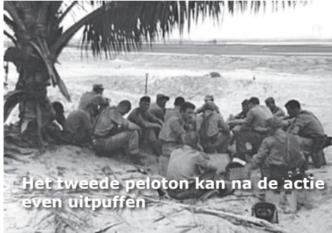
Het tweede peloton kan na de actie even uitrusten

Hier wordt bivak gemaakt en terwijl de meegekomen verbindingman de kazerne in Merauke inlicht maakt de rest een aantal wachtposten gereed. Het wordt een nacht die ik niet snel vergeet. Je bemant een paar keer een van de wachtposten, probeert tussendoor wat te slapen maar onophoudelijk maakt een angstige spanning zich van je meester. Aardedonker is het, je zit of ligt daar vrijwel onbeschermd en je hebt geen idee van wat er zich op honderd, of vijftig, of tien meter afstand van je afspeelt. Eindelijk wordt het weer licht.