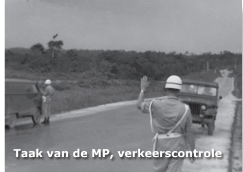
Taak van de MP, verkeerscontrole

Het gerucht werd werkelijkheid. Er moesten ook wachtmeesters naar Nieuw-