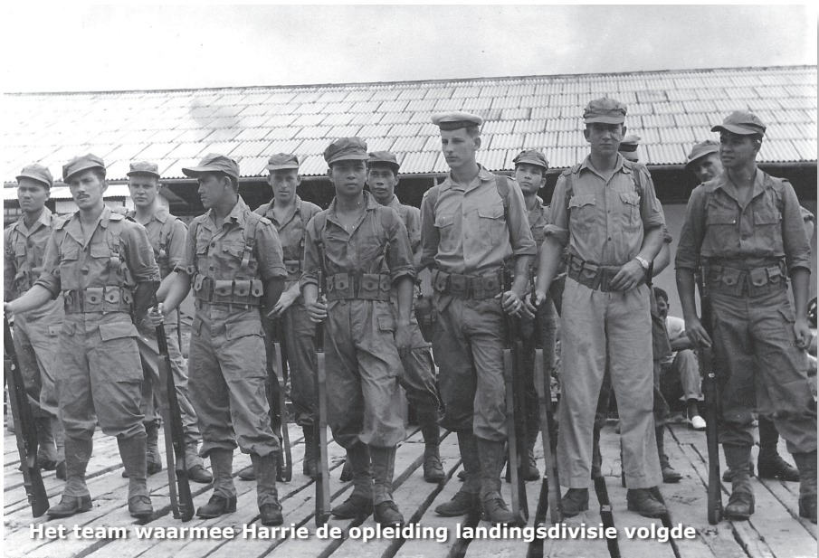
Het team waarmee Harrie de opleiding landingsdivisie volgde

"Begin 1962 werd het ineens allemaal veel spannender", blikt onze hoofdpersoon terug. "Tot aan die 15de januari, rond een uur of acht 's avonds. Het verhaal is bekend. Onze inlichtingendienst wist dat Indonesië een poging zou wagen om een grote invasie uit te voeren. Vier snelle motortorpedoboten waren op weg naar de Aroe-eilanden om daar klaarstaande commando's in te schepen die moesten infiltreren. Een ervan strandde door motorpech. De andere drie bereikten de Molukken en vertrokken met grote snelheid richting de kust van Nieuw-Guinea. Wij en de Evertsen werden eropaf gestuurd.