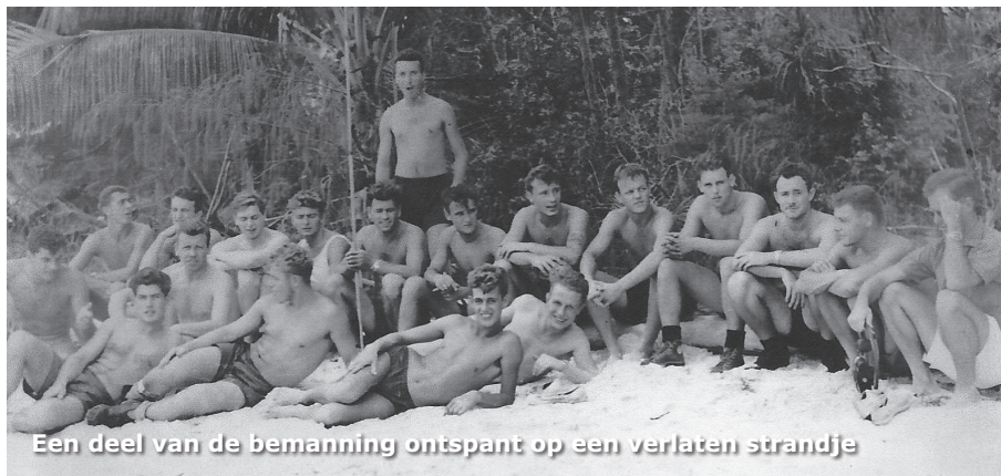
Een deel van de bemanning ontspant op een verlaten strandje

Maar er was ook tijd voor ontspanning. Vanaf het schip met een bootje naar een mooi strandje om daar heerlijk te zwemmen of te bakken in de zon. We deden regelmatig plaatsen als Manokwari, Sorong of Hollandia aan. En we gingen 'n keer voor groot onderhoud naar Hongkong. Voor ons best wel een spannende vakantie.