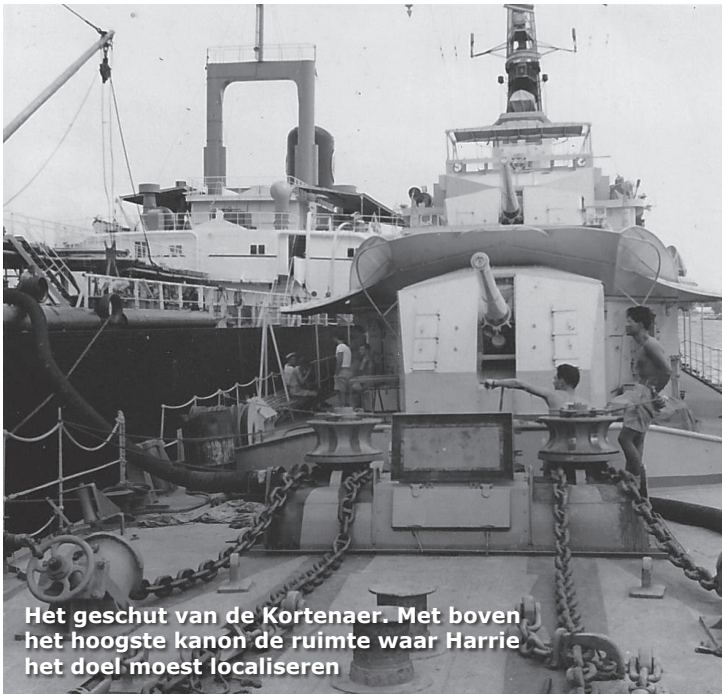
Het geschut van de Kortenaer. Met boven het hoogste kanon de ruimte waar Harrie het doel moest localiseren