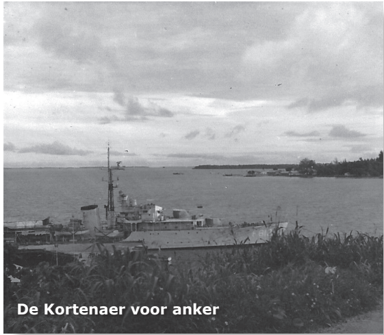
De Kortenaer voor anker