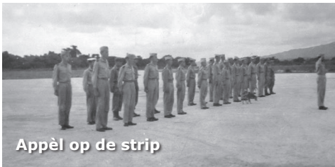
Appèl op de strip

De volgende dag kreeg ik een aubade door dit korps. Best wel emotioneel! Ik ben een veteraan. Ik voel me echter geen veteraan. Ik was meer een vakantieganger die op staatskosten met een cruise heen en een vliegreis terug Nieuw-Guinea mocht ontdekken