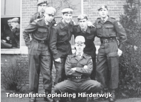
Telegrafisten opleiding Harderwijk