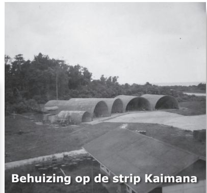
Behuizing op de strip Kaimana