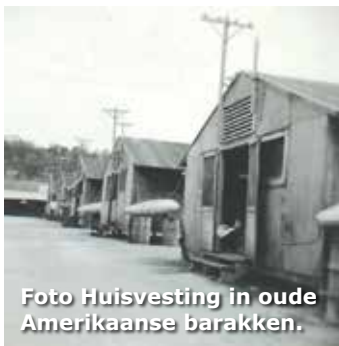
Foto Huisvesting in oude Amerikaanse barakken.

Dat was nu het onderkomen van het Nederlandse leger.