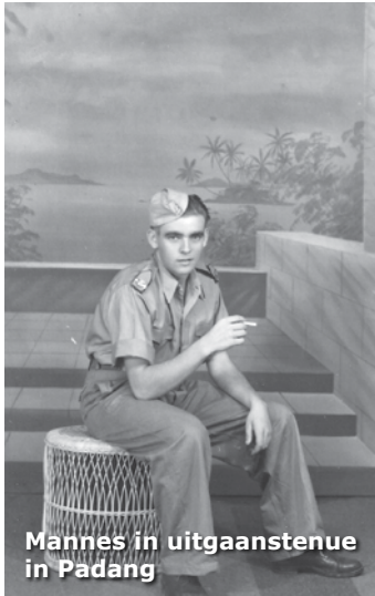
Mannes in uitgaansteneue in Padang

wapen niet nat werd. Dus altijd je geweer boven je hoofd houden.”