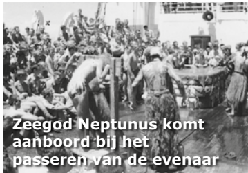
Zeegod Neptunus komt aanboord bij het passeren van de evenaar

Zoals gemeld was de eindbestemming Sorong. Eerst werd Biak aangedaan, toen Hollandia en tenslotte ging de laatste groep in Sorong van boord.