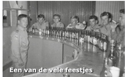
Een van de vele feestjes

Op een gegeven moment kreeg ik te horen dat er een andere auto op mijn naam was gezet. Een Fiat 2100. Ik moest nu de plaatsvervanger van U Tant, de secretarisgeneraal van de Verenigde Naties, gaan rijden, in burger. Daarvoor werd mijn burgerrijbewijs in Hollandia overgeschreven. Het was weer een nieuwe ervaring. Ik sprak gelukkig een paar woordjes Engels. Kijk, dit heb ik van hem gekregen."