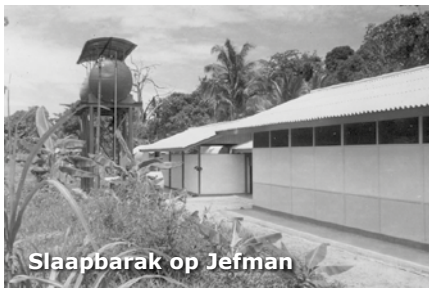
Slaapbarak op Jefman

Ons groepje bleef meestal in en rond het kamp. Soms gingen we wel eens kijken bij de vliegtuigwrakken die aan de andere kant van het kamp in de bush langs de landingsbaan lagen. Deze waren hier tijdens de WO11 gecrasht en gewoon van de landingsbaan geschoven. Ze waren overwoekerd door de bush en lang niet meer compleet. Maar ik vond het altijd wel interessant om de techniek te bekijken. Techniek boeide me altijd.