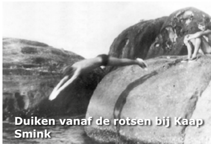
Duiken vanaf de rotsen bij Kaap Smink

gebruik van handwapens. Zo hadden de kinderen een grote katapult gemaakt van een gevorkte tak en stroken van een autobinnenband. De voet van de tak groeven ze in op het strand en dan trokken ze met tweeën of drieën de band waarin zich een steen van ongeveer vier centimeter bevond strak. Op deze manier schoten ze op twintig of dertig meter de zeemeeuwen uit de lucht. Op een dag, toen ik weer 'op wacht' moest waren we bij het wachtlokaal een beetje met onze bajonet op een palmboom aan het gooien. Soms lukte het ook nog om die bajonet in de stam te gooien. Een Papoea, het hulpje van de kok, stond dit een beetje geringschattend aan te kijken. "Kun jij het beter", vroeg een van ons. Hij zei niks. Nam een kapmes en liep zo'n dertig meter achteruit. Daarna nam hij een aanloop van een paar meter en smeedt dat kapmes klem in de boom."