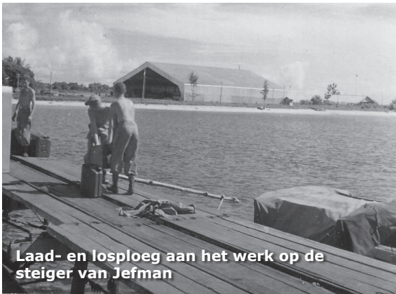
Laad- en losploeg aan het werk op de steiger van Jefman

kampongs in de buurt van tevoren op de hoogte gebracht. Voor ons staken allemaal van die rotsblokken uit het water. Komt er ineens een Papoea in een prauw achter zo'n rotsblok vandaan gepeddeld. Terwijl mijn kogels toch echt die kant op gingen. Man, mijn hart stond stil. Maar het liep gelukkig goed af."