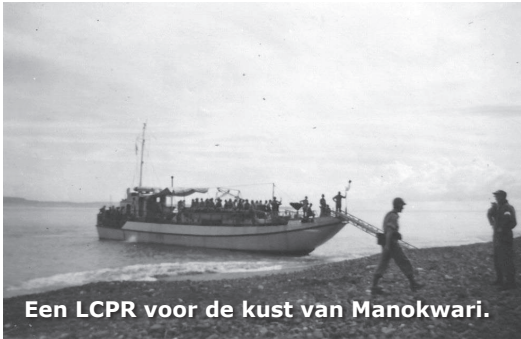
Een LCPR voor de kust van Manokwari.

dat je, zeg maar, een vaste verblijfplaats op een kazerne had. Met een eigen kast en een goed bed. Soms was het wel eens behelpen. Maar soms hadden we ook wel een luxe onderkomen. In Sorong sliepen we bijvoorbeeld in van die leegstaande bungalows. Daar hadden oorspronkelijk gezinnen van beroepsmilitairen, ambtenaren of personeel van Oliebedrijven gewoond. Maar de vrouwen en kinderen waren intussen gerepatriëerd naar Nederland.”