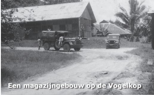
Een magazijngebouw op de Vogelkop

de geluiden. Ik heb heel wat keren op scherp gestaan. Mijn wapen doorgeladen. Maar het waren toch nooit infiltranten die de zaak wilden opblazen. Meestal vogels of andere dieren. Eén keer lag ik, toen ik onraad meende waar te nemen, in dekking in een greppeltje. Klaar om te vuren. Net op dat moment komt mijn aflossing. Die zag me niet liggen en struikelde pardoes over me heen."