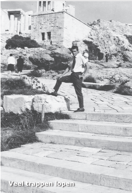
Veel trappen lopen