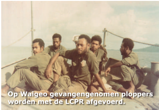
Op Waigeo gevangengenomen ploppers worden met de LCPR afgevoerd.