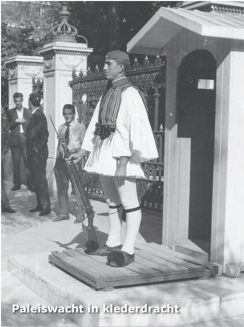
Paleiswacht in klederdracht