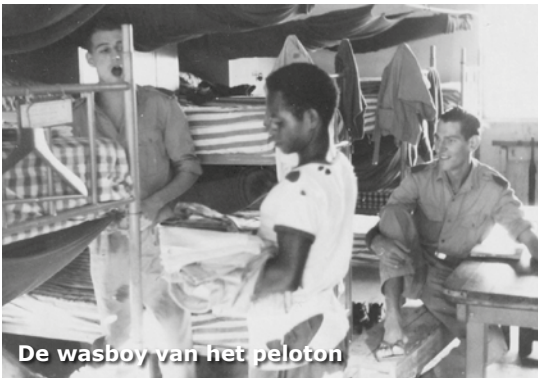
De wasboy van het peloton

De Leeuw begon bij het aanbreken van de dag op 21 september met ongeveer honderd man aan de uitvoering van zijn opdracht. Met Papoeaverkenners voorop ging de compagnie voorzichtig voorwaarts.