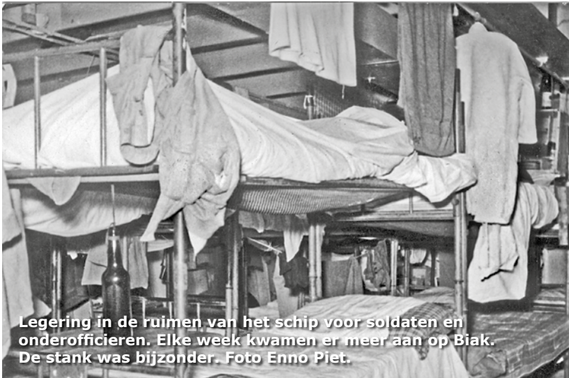
Legering in de ruimten van het schip voor soldaten en onderofficieren. Elke week kwamen er meer aan op Biak. De stank was bijzonder.