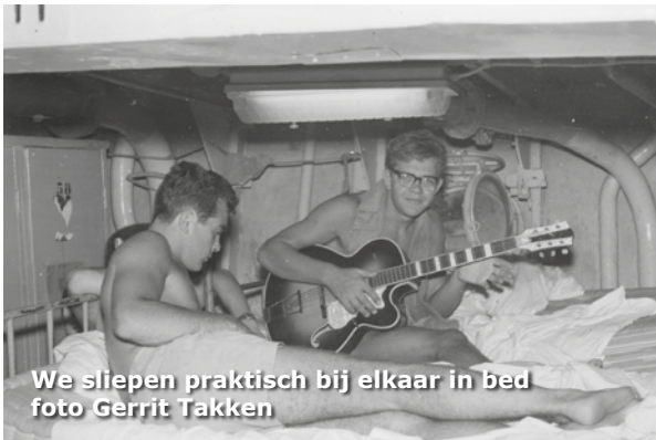
We sliepen praktisch bij elkaar in bed

Onze man uit IJsselmuiden nam op 1 juli 1961 afscheid van Biak. Hij vloog over de Noordpool naar Amsterdam. Nog met een DC-7, een propellerkist. Een reis van 36 uur met twee tussenlandingen. Tokyo en Alaska.