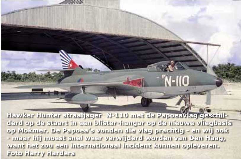
Hawker Hunter straaljager N-110 met de Papoeavlag geschilderd op de staart in een blister-hangar op de nieuwe vliegbasis op Mokmer. De Papoea's vonden die vlag prachtig - en wij ook - maar hij moest snel weer verwijderd worden van Den Haag, want het zou een internationaal incident kunnen opleveren.

Later kwamen er nog veer tien verbeterde Hunters bij. We zijn er vier door ongevallen kwijtgeraakt. Overigens zonder persoonlijke verliezen.