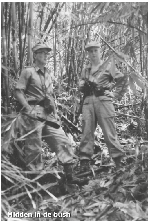
Midden in de bush