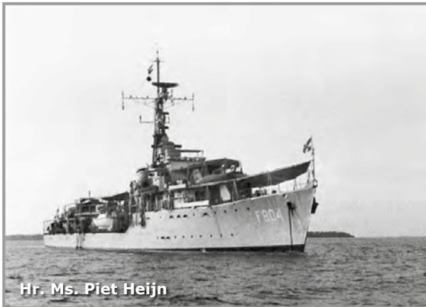
Hr. Ms. Piet Heijn